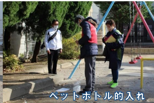
ペットボトル的入れ